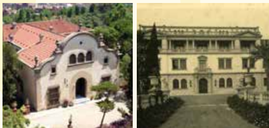
Fachada de la casa y del laboratorio.

Las finalidades de esta institución son fomentar el cristianismo, conservar y promover el estudio de su colección de mueble español, y apoyar la investigación médica.