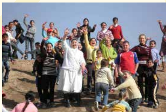
Proyecto AIN de Irak

La Fundación siguiendo las directrices de su fundadora contribuye con apoyo financiero a proyectos de diversas instituciones de caridad cristiana y de otras obras sociales, siguiendo un cuidadoso proceso de selección y seguimiento de los mismos. Así por ejemplo colabora anualmente con Cáritas (Entidades Con Corazón), con Ayuda a la Iglesia Necesitada (actualmente construcción de 15 aulas en Irak para los niños desplazados por la guerra).